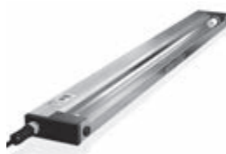
WB Appareils avec écran réfléchissant Aparatos con pantalla reflectora