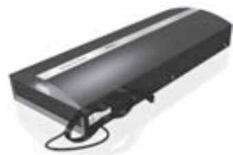
LSK Appareil à décontaminer l'air pour laboratoire Descontaminadoras de recirculación de aire para laboratorios

sterilAir AG Oberfeldstrasse 6 CH-8570 Weinfelden www.sterilair.com