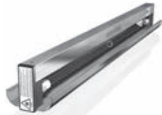
DB Appareils de plafond avec protection anti-éblouissement Equipos de techo con protección de la visión

sterilAir AG Oberfeldstrasse 6 CH-8570 Weinfelden www.sterilair.com