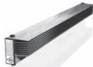
WR Systèmes muraux avec protection de la vue Sistemas de pared con protección de la visión

Votre conseiller spécialisé: Nuestro asesor técnico a su disposición: