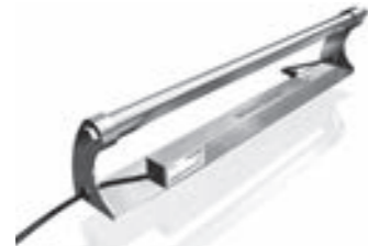
ET-Lab Labortischentkeimung Laboratory bench disinfection