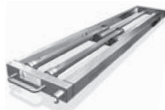
T2012-XL Zerlegebandentkeimer Conveyor belt disinfection