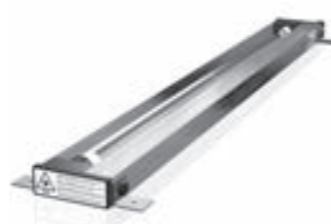
T2100 Standard-Systembaureihe Standard type series

sterilAir AG Oberfeldstrasse 6 CH-8570 Weinfelden www.sterilair.com