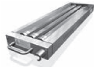
T2011 Desinfektions-Einbausystem Conveyor belt disinfection